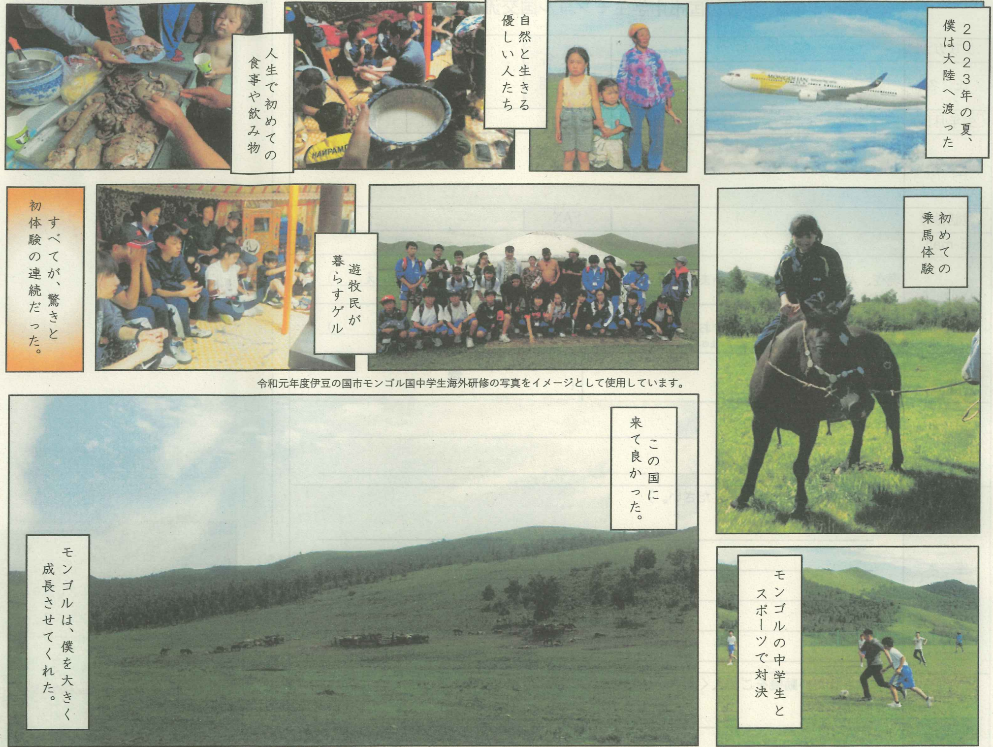
令和元年度伊豆の国市モンゴル国中学生海外研修の写真をイメージとして使用しています。

この事業は、静岡県の東アジア文化都市2023の助成を受けて、伊豆の国市が実施しています。 東アジア文化都市 2023 静岡県 City of East Asia 2023 SHIZUOKA