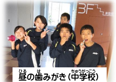
ひるほの歯みがき(中学校)